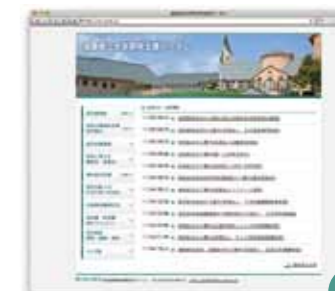
CL 滋賀県立大学地域づくり教育研究センター 様