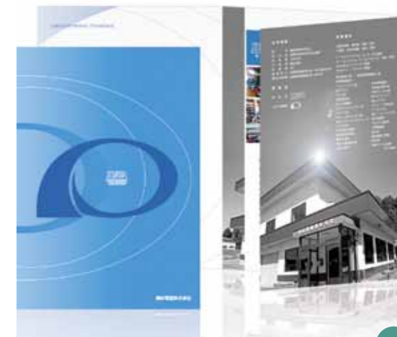
CL 藤田電設株式会社 様