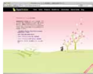
デジタルソリューション株式会社 http://www.ds-j.com/