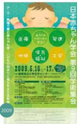
CL 日本赤ちゃん学会 第9回学術集会実行委員会 様