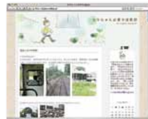
ブログ「ちりちゃんの寄り道日記」 http://digiso.exblog.jp/