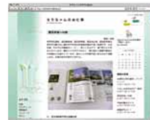
ブログ「ちりちゃんのお仕事日記」 http://dswork.exblog.jp/