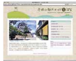
彦根の観光ガイド http://www.ds-j.com/guide/