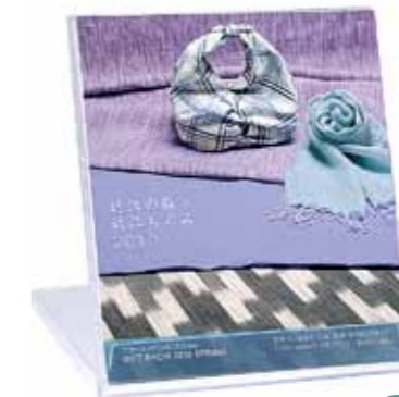
CL 高島市物産振興会 様