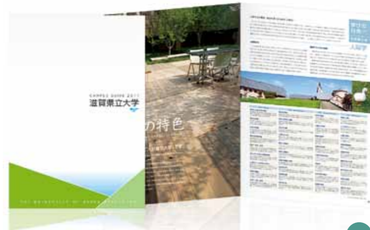
CL 滋賀県立大学 様